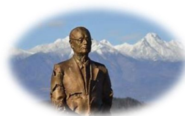
大村先生の銅像に会えるよ♪