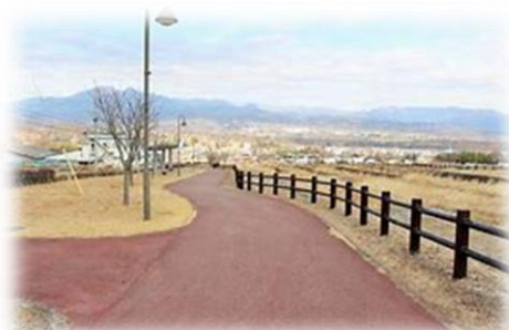
坂道をみんなで歩きます♪