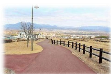
坂道をみんなで歩きます♪